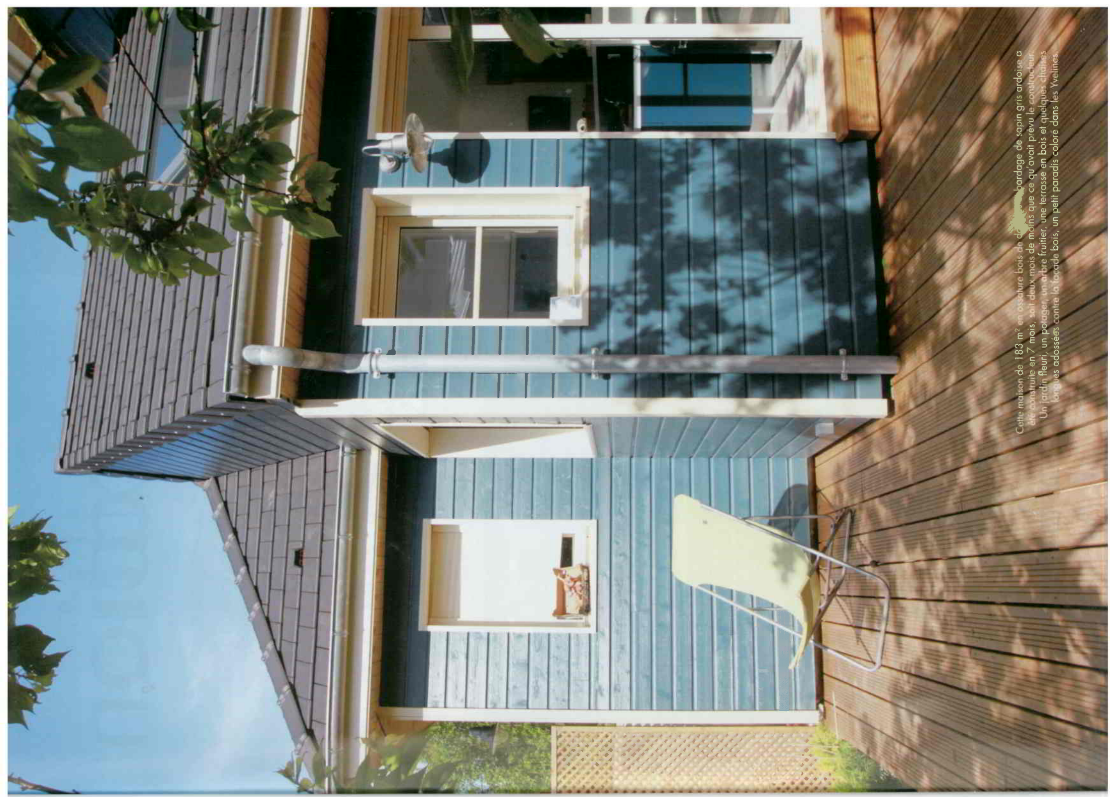
Cette maison de 183 m 2 en ossature bois de chêne bardage de sapin gris ardoise a été construite en 7 mois, soit deux mois de moins que ce qu'avait prévu le constructeur. Un jardin fleuri, un potager, un arbre fruitier, une terrasse en bois et quelques chaises longues adossées contre la façade bois, un petit paradis coloré dans les Yvelines.